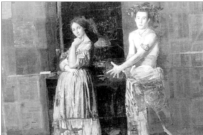
'A condessa de Hanssonville', ano 1945, de Ingres. Retrato nobiliario co recurso do espello