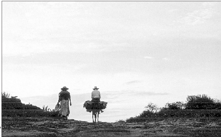
Fotografía titulada 'Nada de esto es sueño', de Juan Rulfo, fechada entre 1940 y 1945

Un hábito que se inicia "en la infancia, coleccionando cromos, cómics y fascículos de revistas. Luego, mi espíritu coleccionista se nutrió de aquello con lo que trabajaba y exponía, y de las obras que se exhibían en mi galería pasé a buscar una imagen concreta, un autor preferido, creando los fondos de la sala".