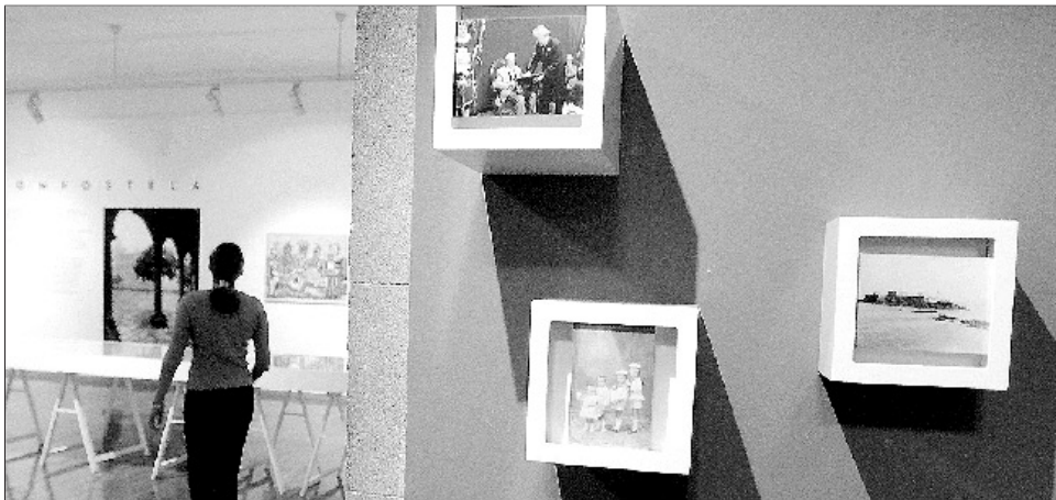
Detalle da exposición 'Imaxes da Memoria' na Fundación Granell, en Santiago